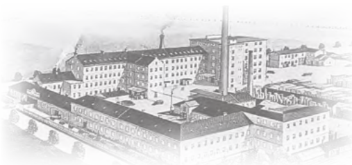
Továrna PETROF v Hradci Králové