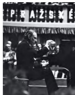
Arturo Benedetti Michelangeli