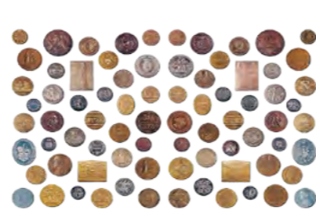
Medaile značky PETROF