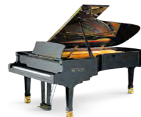
Nová generace klavírů