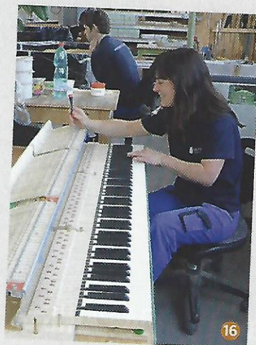
16. Réglage de piano à queue.